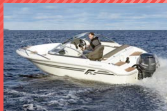
FINNMASTER 55 BR

Hinta: 20 200 € (ilman moottoria) 30 590 € (100 hv Yamaha F100)