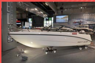
AMT 190 BR

Hinta: 21 900 € (ilman moottoria) 31 990 € (100 hv Honda BF100)