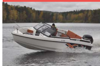
BELLA 550 BR

Hinta: 18 900 € (ilman moottoria) 23 390 € (100 hv Mercury F100)