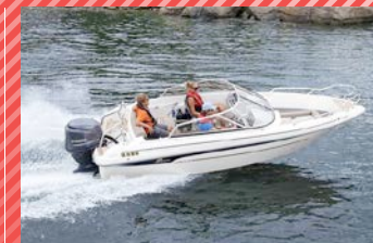
YAMARIN 56 BR

Hinta: 18 850 € (ilman moottoria) 29 240 € (100 hv Yamaha F100)